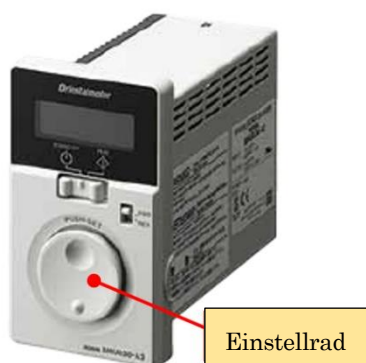
[Produkt im Auslieferungszustand]